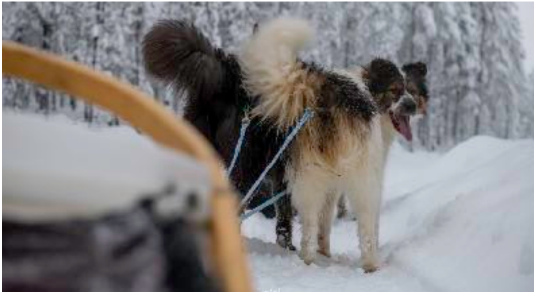
KAPPI, PRÊTE POUR L'AVENTURE